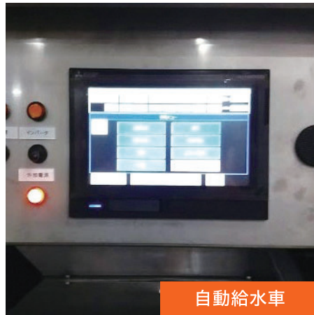
自動制御操作パネル

タッチパネルで、給水作業の設定、操作を行います。給水作業に伴うバルブの開閉と出水量を自動で行います。タブレットによる自動操作も可能で作業人員削減に役立ちます。