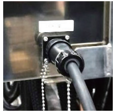
外部電源コンセント